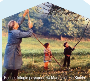
Rouge, trilogie paysanne © Madeleine de Sinéty