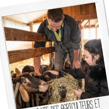
LA VIE DES AGRICULTEURS ET PRODUCTEURS