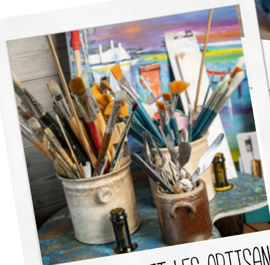
LES ARTISTES ET LES ARTISANS