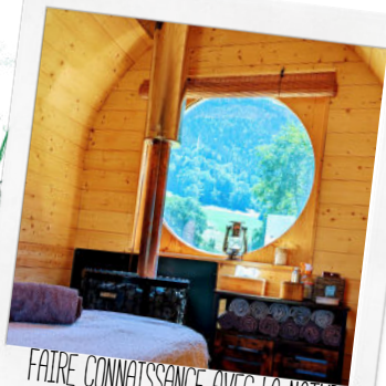
FAIRE CONNAISSANCE AVEC LA NATURE ET LE BIEN ETRE